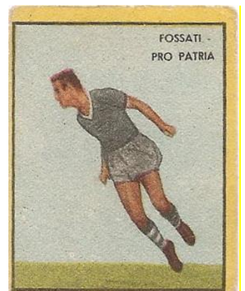
FOSSATI - PRO PATRIA