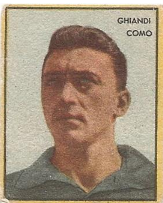
GHIANDI - COMO