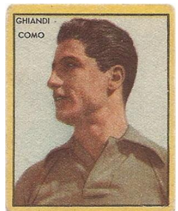
GHIANDI - COMO