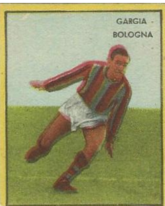
GARGIA - BOLOGNA