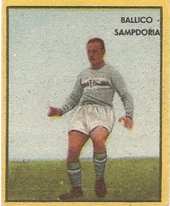
BALICO - SAMPDORIA