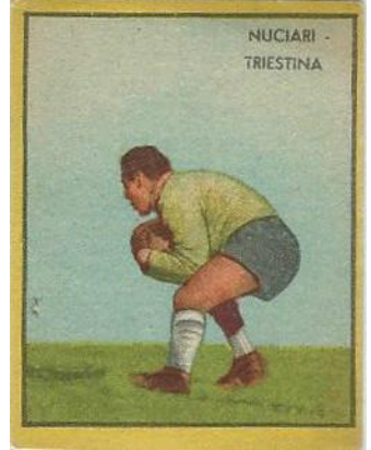
NUCIARI - TRIESTINA