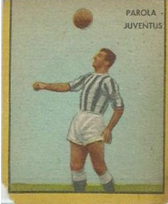
PAROLA - JUVENTUS