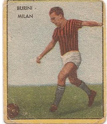
BURINI - MILAN