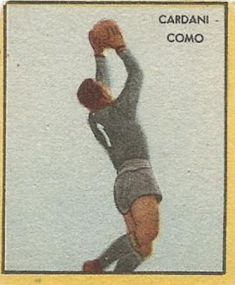
CARDANI - COMO