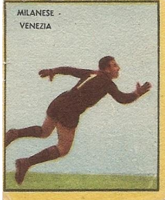
MILANESE - VENEZIA