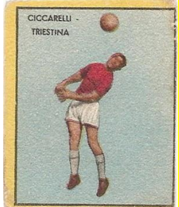
CICCARELLI - TRISTINA