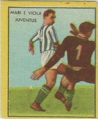
MARI E VIOLA JUVENTUS