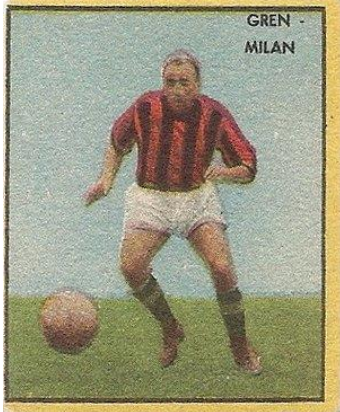
GREN - MILAN