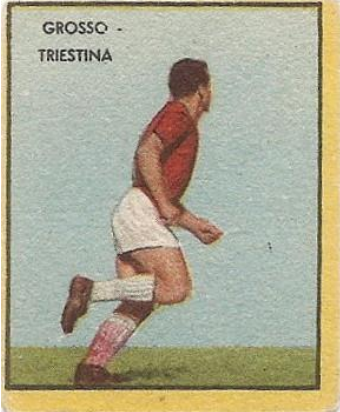
GROSSO - TRIESTINA