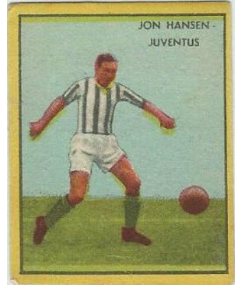
JON HANSEN - JUVENTUS